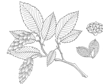
Ostrya carpinifolia Scop. (1772)

Al termine del corso potrà essere effettuata una visita guidata a situazioni forestali di particolare interesse in data da concordare con i partecipanti